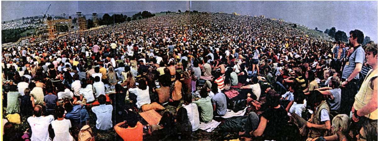
Les années 60, une époque de grands rassemblements. Ci-dessus, le festival de Woodstock en 1969

Progressivement, au fil des années 60, l'importance du texte s'effacera devant le pouvoir d'attraction de musiques comme la pop music, le rock ou la soul music .