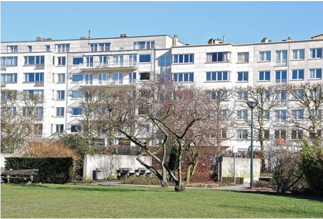
Une barre HLM (Habitations à Loyer Modéré)

L'accroissement de la population , dû au baby boom et à la décolonisation, conduit à une crise du logement.